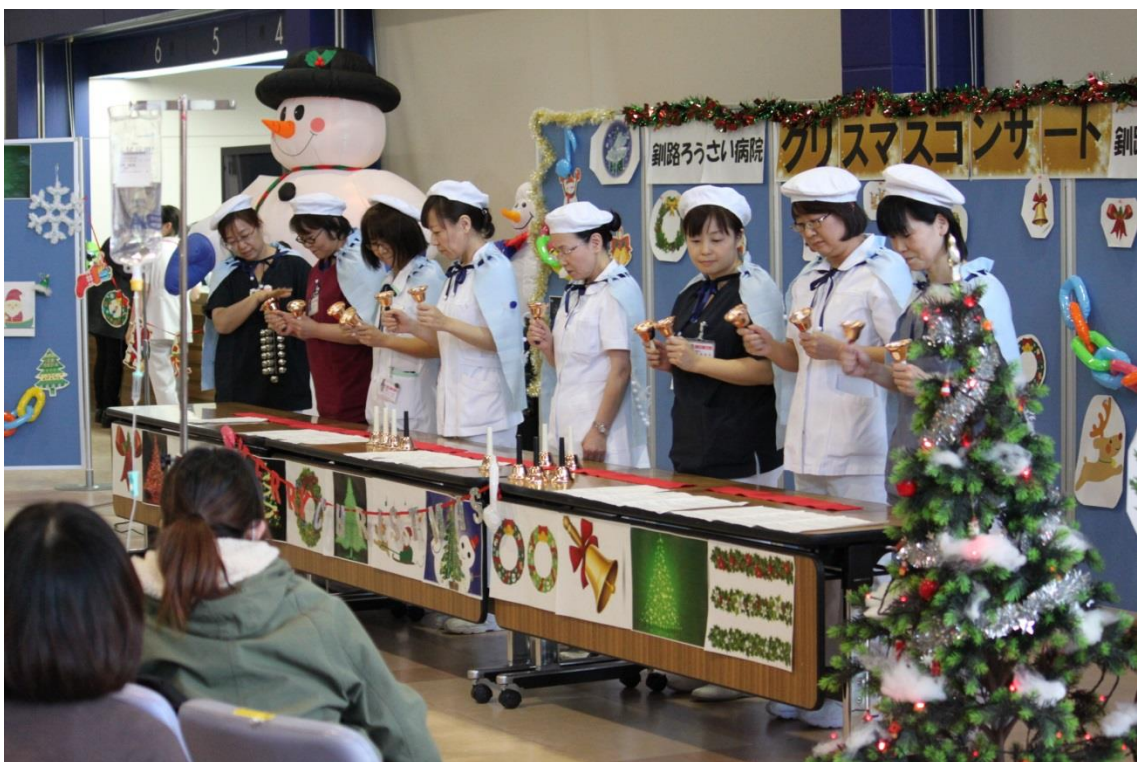
～看護部によるハンドベル演奏～