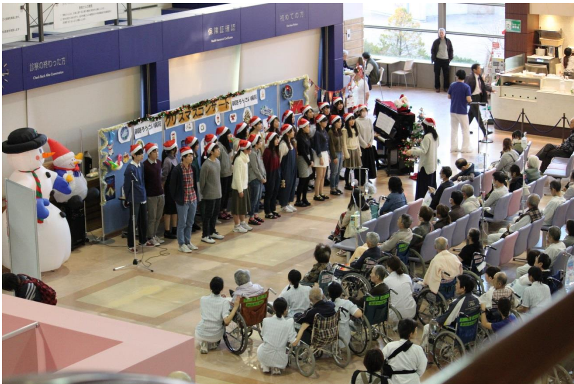
～看護学生による合唱～