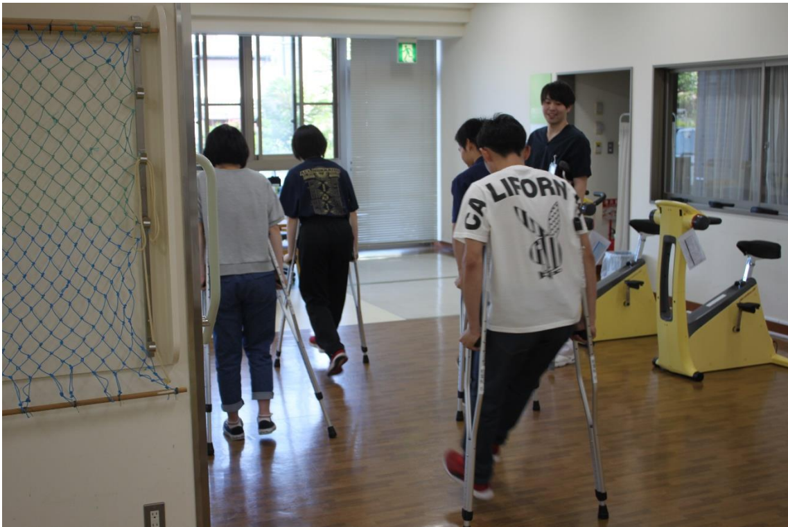
リハビリ模擬体験