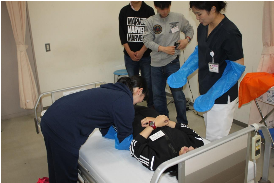
看護体験（ポジショニング）